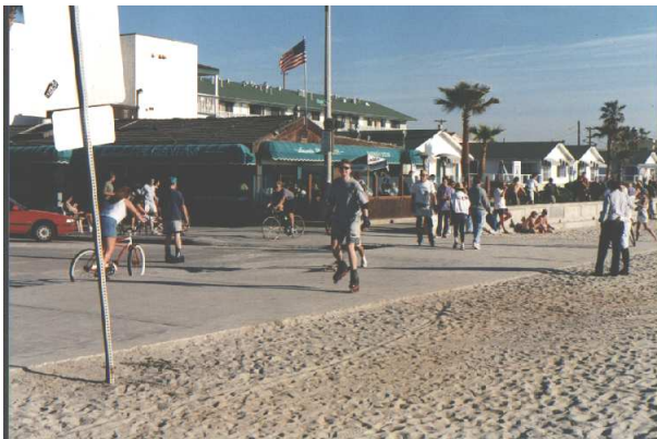
Abbildung 1: Wohl einer der besten Rollerblader am Strand von San Diego.