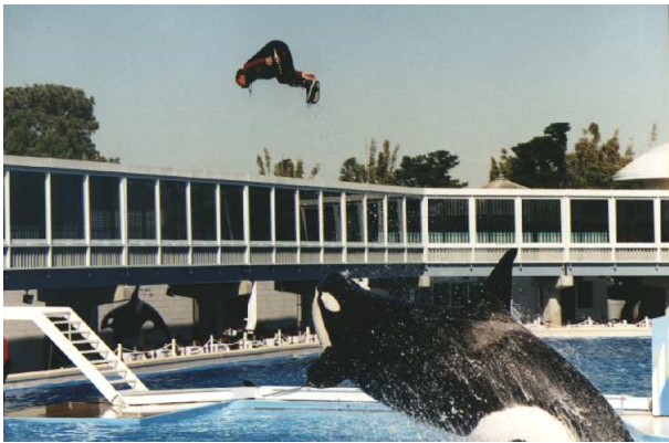
Abbildung 4: ... und Menschen!