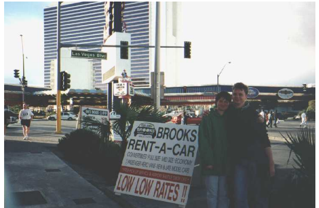
Abbildung 6: "Brook's Rent A Car" – Die Autovermietung in der wir uns vor 10 Jahren zum ersten Mal über den Weg liefen – immer noch im Geschäft!

mit allem Komfort ausgestattet war (inclusive Pool und Hot Tub); so eine richtige Luxusvilla eben.