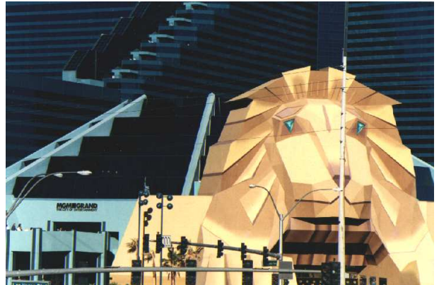
Abbildung 5: Das größte Hotel der Welt: Das MGM in Las Vegas