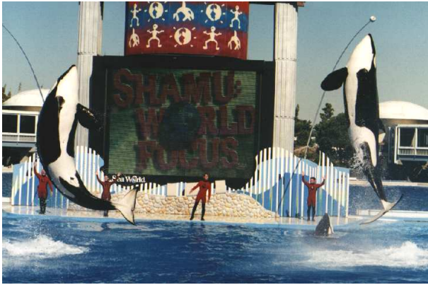
Abbildung 3: Seaworld: Wo Wale hüpfen