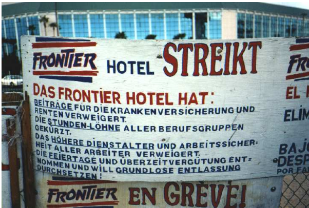
Abbildung 8: Ein Streik im Casino "Frontier": Die Angestellten kommen sich ausgenutzt vor und appellieren an deutsche Touristen, das Casino zu boykottieren.

dass wir froh sein könnten, dass die Polizisten nicht die beiden Vans miteinander verwechselt hätten. Dann hätte man uns nämlich die Hand-schellen angelegt.