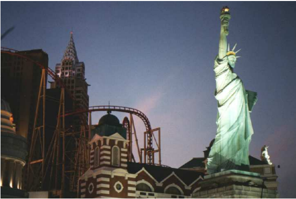
Abbildung 7: Nein, das ist nicht New York, nur das Casino "New York, New York" in Las Vegas