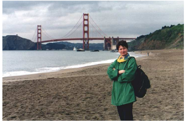
Abbildung 9: Am Baker Beach in San Francisco. Windig aber schön!