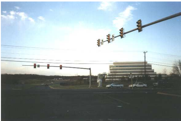
Abbildung 1: Das Hauptquartier von AOL – in Dullas, Virginia