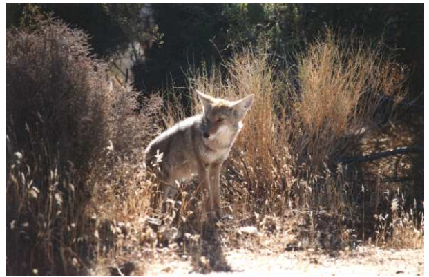
Abbildung 4: Ein kleiner Koyote