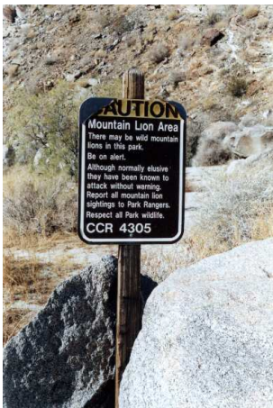
Abbildung 5: Warnung vor dem Berglöwen