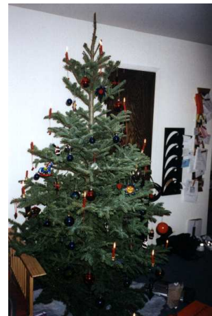
Abbildung 9: Der (echte!) Weihnachtsbaum in San Francisco