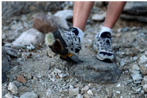
Abbildung 7: ... die sich sogar in den Schuh bohren!