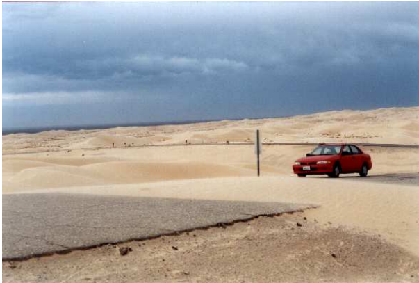
Abbildung 2: Die Wüsten bei San Diego – viel Sand und ein Mietauto!

steht, besteht nur aus Autobahnen und Riesen-Supermärkten und ist wirklich schnarchlangweilig, da merkt man echt, was San Francisco mit seinem internationalen kunterbunten Durcheinander für eine Ausnahme an amerikanischen Städten ist. Wer wollte woanders wohnen!