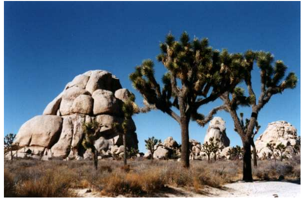
Abbildung 3: Die typischen Joshua-Bäume in der Wüste

Auf dem Weg in ein recht steiniges Gebiet am Fuße eines Berges, wo wir laut Reiseführer einen Wasserfall zu finden hofften, stießen wir auf eine Tafel, die vor Berglöwen warnte, und tatsächlich kommen diese nicht ganz ungefährlichen Tiere hier in Amerika recht häufig vor – so waren