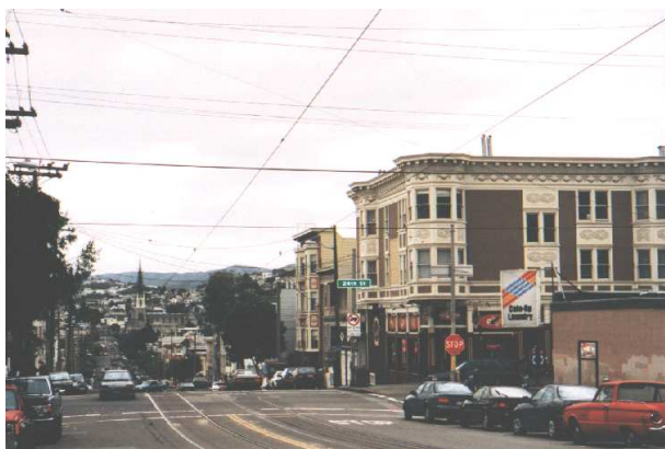
Abbildung 6: Church-Street und Waschsalon nebenan.