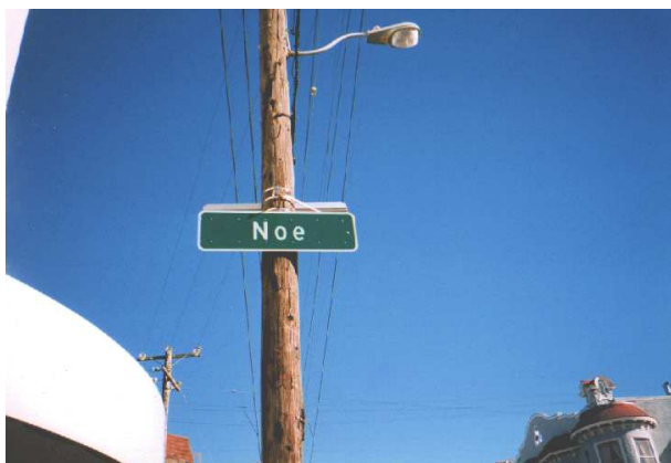
Abbildung 5: Natürlich gibt's in Noe Valley auch eine Straße namens "Noe Street"