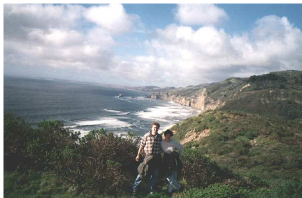
Abbildung 9: Der Pazifik bei Point Reyes.

Na, hättet ihr die Antworten gewusst? Der Test war übrigens auf Deutsch. Die theoretische Prüfung kann man wirklich in allen Sprachen dieser Welt machen. In San Francisco trifft man übrigens sehr häufig auf