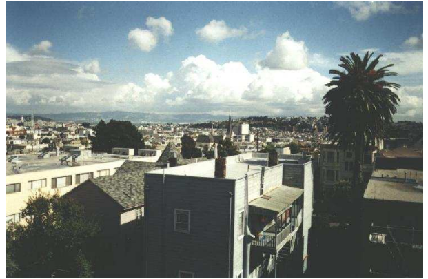
Abbildung 3: Vor dem Wohnzimmerfenster: Palme, Downtown und Bay