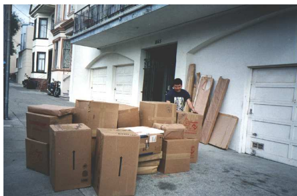
Abbildung 7: Die Umzugskiste aus München kommt in San Francisco an.

Nun noch einmal zurück zu unserem Stadtviertel: Was noch sehr wichtig ist, Noe Valley ist sehr sicher, d.h. man kann sich zu jeder Tages- und Nachtzeit frei auf den Straßen des Viertel bewegen, ohne sich ängstigen zu müssen. Zur Zeit stört mich wirklich am meisten, dass ich immer überlegen muss, wo ich bedenkenlos hingehen kann und wo nicht. Manchmal hat das auch zur Folge, dass man lieber einen Umweg in Kauf nimmt, bevor man sich in ein unsicheres Viertel begibt. San Francisco ist diesbezüglich wirklich eine typische amerikanische Großstadt; völlig ruhige Wohngegenden werden zwei Straßen weiter zu einem total heruntergekommenen Viertel, das man bei Einbruch der Dunkelheit tunlichst meiden sollte. Leider hat Michael ein sicheres Gespür dafür, die etwas "verhauten" Viertel zu finden. So waren wir an einem Sonntag mit dem Bus unterwegs und sind durch ein Viertel gefahren, in dem wir auch bei Tag nicht hätten aussteigen wollen. Am Straßenrand standen nur noch ausgebrannte Autowracks herum, die Müllberge türmten sich und es war