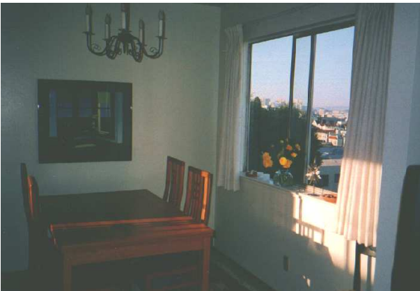
Abbildung 2: San Francisco. Aus dem Wohnzimmerfenster geschaut.