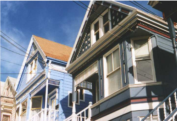
Abbildung 1: Das Stadtviertel Noe Valley